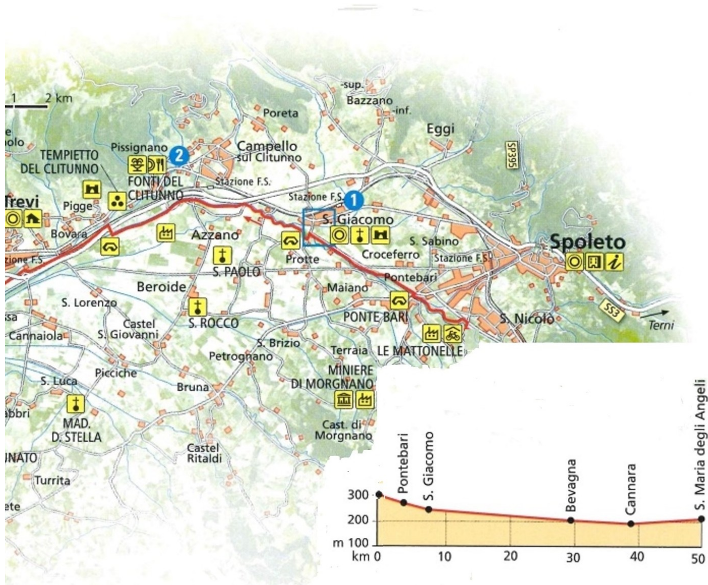
Mappa TCI "Giro in Italia" Centro-Sud 2010