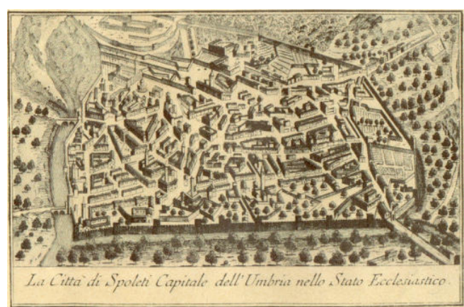
TAVOLA DEL SISTEMA INSEDIATIVO