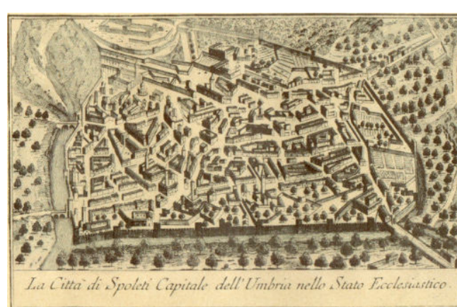
TAVOLA DEL SISTEMA INSEDIATIVO