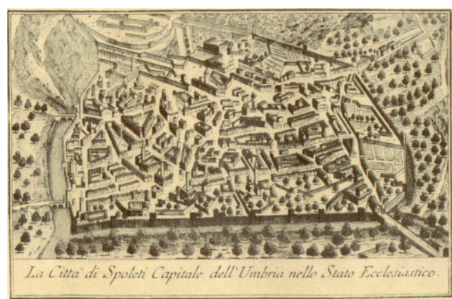
TAVOLA DEL SISTEMA INSEDIATIVO